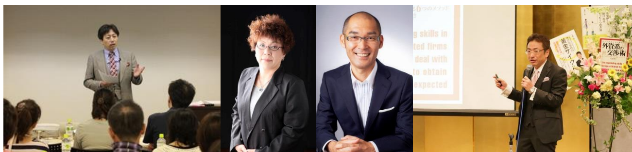
業務改善・キャリア教育