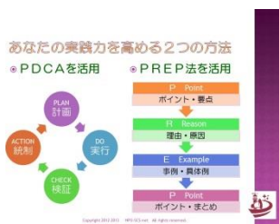
社会人意識の定着