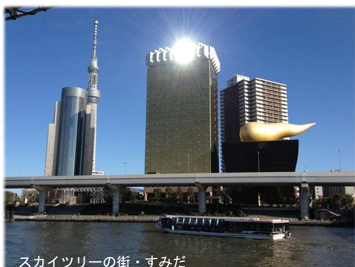
スカイツリーの街・すみだ